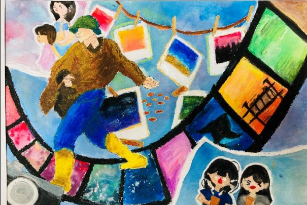
水彩鋪色+細節描摹+蠟筆完稿+作品分享