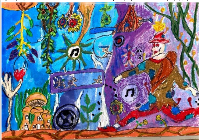
水彩鋪色+細節描摹+蠟筆完稿+作品分享